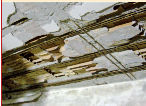
[FIG. 2] - Condizioni iniziali del solaio / Floor starting conditions

di rovings continui e mats unifilo) inglobato in una resina che conferisce rigidità all'insieme.