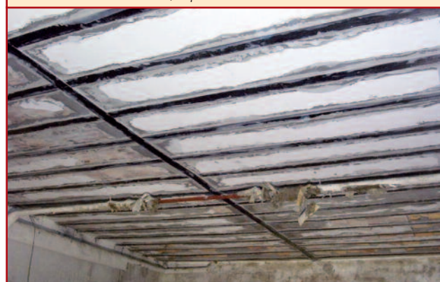
[FIG. 5] - Tubazione del solaio / Pipeline in the floor

sulla lamina ha consentito una totale distribuzione della resina su tutta l'interfaccia lamina calcestruzzo. Terminata la riparazione della trave tramite l'applicazione delle lamine in CFRP, l'efficienza dell'intervento è stata controllata tramite l'esecuzione di una prova di carico, che ha dimostrato gli straordinari risultati ottenibili con questo tipo di rinforzo.